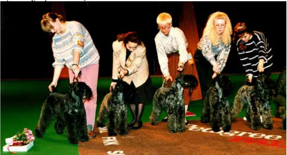
Kantanarttuni Merry Blue Violetin voittosa BIS-1 jälkeläisluokka Messukeskuksessa 5.-6.3.1994

ovat erityisesti ne, kun kasvatinomistaja kertoo olevansa tyytyväinen omaan koiransa. Kasvatustyön suolana voi pitää myös keskusteluja toisten kasvattajien kanssa, joista erityisesti mieleenpainuvimpia ovat olleet ulkomaisten pitkän linjan kasvattajien tietotaidon saaminen omaan käyttöön.