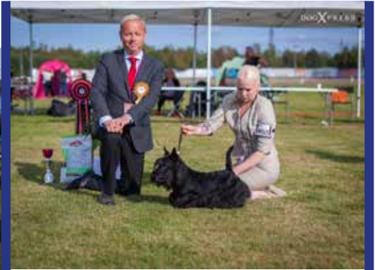
RYP2 skotlanninterrieri Sirkiss Set The Pace om. Vuorimies Jelena