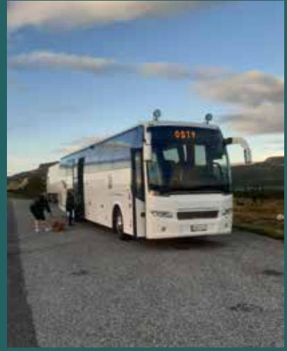
Tauolla Kilpisjärven jälkeen Norjan puolella.