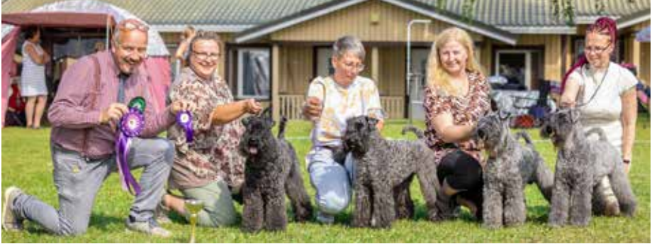
Erikoisnäyttelyn 2023 ROP-kasvattajaryhmä