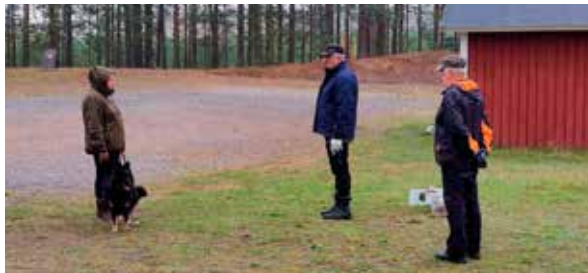
Teksti ja kuvat: Virve Sipola