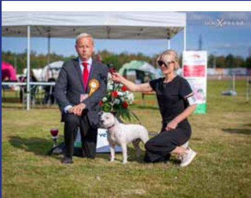
RYP3 staffordshirebullterrieri Double Star's White Night Fantasy om. Pylkäs Teija